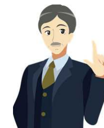
司馬アドバイザー （専門家とのチャット）