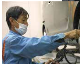
感染症リスク発生時の 連携企業による共助の実現