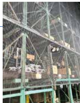
防護ネットによる 落下防止策