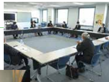
事業者ネットワークによる 強固な連携

取り組み事例について、以下の強靱化サイトでは、動画などで詳しく紹介しています。強靱化サイトには他にも参考事例を紹介していますので、ぜひご覧ください