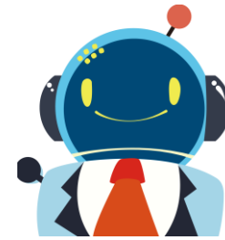
こーめい1号 (AIチャットボット)