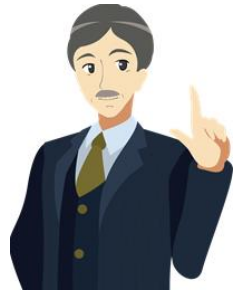
司馬アドバイザー (専門家とのチャット)